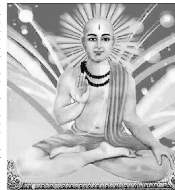
संत पीपा जी

पीपाजी महाराज का संपूर्ण जीवन चमत्कारों से भरा हुआ रहा। राजकाल में देवीय साक्षात्कार करने का चमत्कार प्रमुख है। उसके बाद संन्यास में स्वर्ण द्वारिका में सात दिनों का प्रवास, पीपावाव में रणछोडराय जी की प्रतिमाओं को निकालना व अकालप्रसन्न इस में अन्न क्षेत्र चलाना, सिंह को अहिंसा का उपदेश देना, लाठियों को हरे बांस में बदलना, एक ही समय में पांच विभिन्न स्थानों पर उपस्थित होना, मृत तेली को जीवनदाय देना, सीता जी का सिंहनी के रूप में आना आदि कई चमत्कार