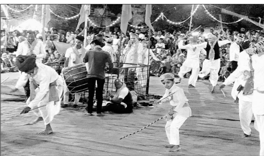
नगर के जोशिला हनुमान मंदिर प्रांगण में हनुमान जन्मोत्सव को लेकर आयोजित मेला व अन्य कार्यक्रम के तहत आयोजित गैर नृत्य देर रात तक जमा रहा।

कानोड़, (निर्स)। नगर के जोशिला हनुमान मंदिर प्रांगण में हनुमान जन्मोत्सव को लेकर आयोजित मेला व अन्य कार्यक्रम के तहत गुरुवार रात को मंदिर परिसर में आयोजित गैर नृत्य देर रात तक जमा। रूण्डेडा गांव के मेनारिया समाज के लोग मेवाड की परंपरा व संस्कृति को जीवंत रूप देते हुए पारंपरिक मेवाडी पाडी सहित परिधानों में पहुंचे। यहाँ मंदिर मण्डल के पदाधिकारियों ने उनका स्वागत सम्मान किया। इसके बाद ढोल की थाप पर गैर नृत्य शुरू हुआ जो रात करीब 12 बजे तक चला।