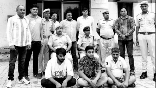
पुलिस ने हत्या के मुख्य आरोपियों को गिरफ्तार किया।