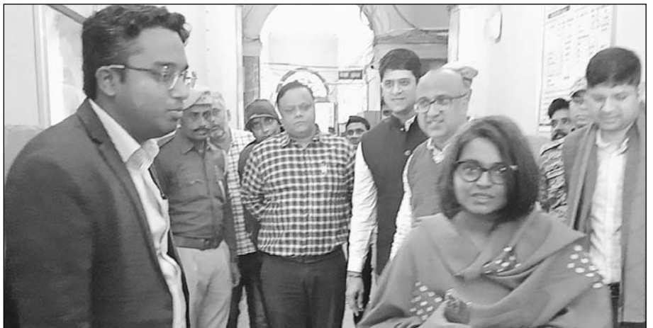
बीकानेर कलेक्टर और नगर निगम प्रशासक नम्रता वृष्णि ने निगम कार्यालय का निरीक्षण किया।

तथा निगम की आय बढ़ाने के संबंध में चर्चा की। जिला कलेक्टर ने शिव बैली में कचरा निस्तारण केन्द्र तथा बायो