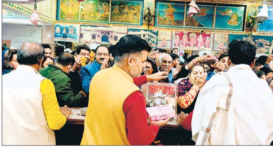
नववर्ष-2023 की अलसुबह राजधानी जयपुर के आराध्यदेव गोविंददेवजी मंदिर में श्रद्धालुओं की भीड़ उमड़ी। लोगों ने भगवान से आशीर्वाद लेकर अपने घर-परिवार की सुख-शांति की कामना की। उधर खोले के हनुमान मंदिर में भी दिनभर श्रद्धालुओं का तांता लगा रहा। यहां भगवान को पीषबड़ा प्रसादी का भोग लगाने के बाद करीब 70 हजार भक्तों में भी प्रसादी वितरित की गई।