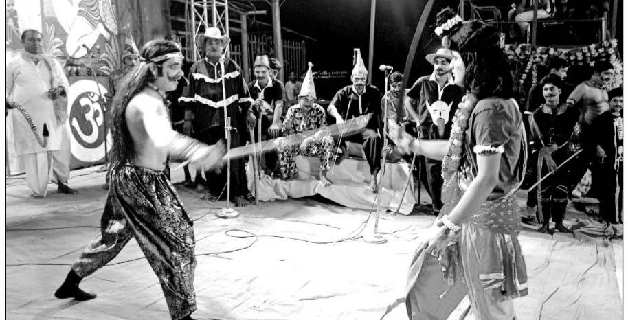
फुलेरा की रेलवे कॉलोनी स्थित रंगमंच पर रामलीला जारी।