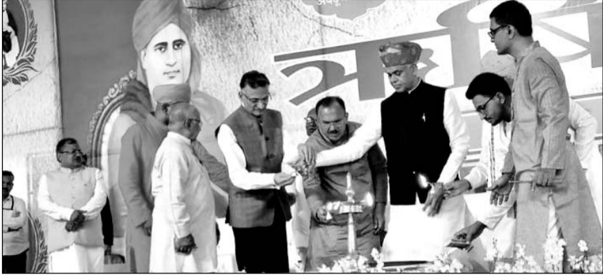
गुजरात के राज्यपाल आचार्य देवव्रत ने ऋषि मेले का शुभारंभ किया।

देवव्रत ने कहा कि लोग देसी गौमाता, प्राकृतिक कृषि और पर्यावरण के संरक्षण का संकल्प लेंगे। महर्षि दयानन्द सरस्वती की 200 वीं जयंती इसी मिशन के साथ मनाई जा रही है। आर्य समाज सदा से ही समाज व देश सेवा में अग्रणी रहा है। महर्षि दयानन्द सरस्वती जो देश के बड़े समाज सुधारक और सांस्कृतिक मूल्यों के संस्थापक, संस्कृति के प्रचारक रहे हैं उनके विचार जनमानस तक पहुंचे इस