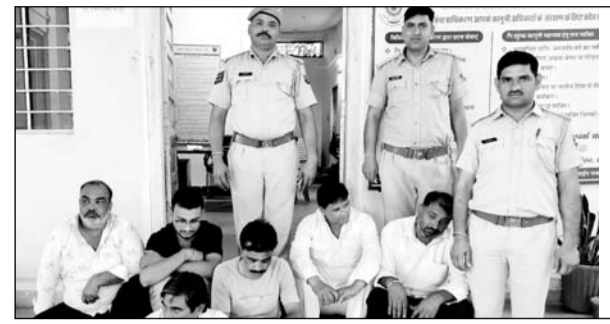
बरोनी थाना पुलिस ने जुआरियों को गिरफ्तार किया।