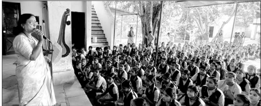
पांच हजार से अधिक बालिकाओं एवं विद्यार्थियों को "आवाज दो" कार्यक्रम की विस्तृत जानकारी दी।