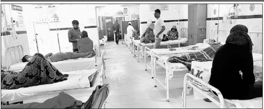
पावटा अस्पताल में भर्ती मरीज।

अस्पतालों में बुखार के मरीजों की भारी भीड़