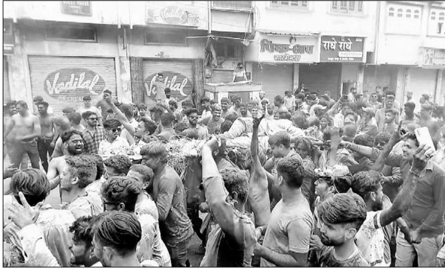
भीलवाड़ा शहर में परंपराओं के अनुसार मुर्दे की सवारी निकाली गई, इसका शहरवासियों ने आनंद लिया।

वाले की हवेली के पास से मुर्दे की सवारी (ईलाजी की डोल) निकली गई। इसमें जिंदा युवक की अर्थां सजाकर बाजार में घुमाया गया और युवक गुलाल उड़ाते हुए चलते रहे। कुछ युवक अर्थां पर लेटे युवक पर