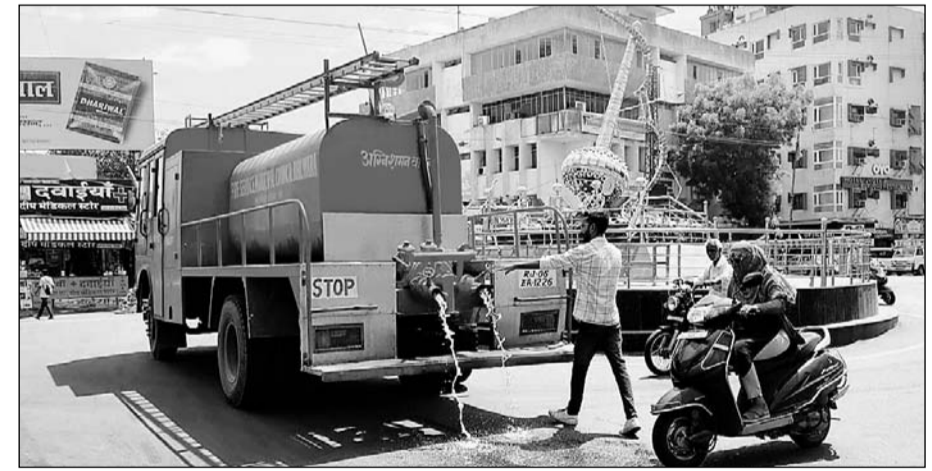
भीलवाड़ा में प्रशासन द्वारा शहर की सड़कों को टंडा रखने के लिए सड़कों पर फायर ब्रिगेड की मदद से पानी का छिड़काव करवाया जा रहा है।

नगर व्यास ने पंचांग के आधार पर बताया कि इस बार देशभर में अच्छी बारिश होगी। राजस्थान में मंडूकछाप नदी कहीं अधिक लेगी। कहीं कम बारिश के योग्य बन रहे हैं। भीलवाड़ा में औसत बारिश होगी। फिलहाल औद्योगिक नगरी में पड़ रही भीषण गर्मी ने शहर की सड़कों को सूना कर दिया है। आमजन रोजमर्रा के कामों