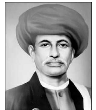
महात्मा ज्योतिबा फुले

हवा। असल में वर्ष 1848 में उनके साथ एक ऐसी घटना घटी जिसने उन्हें झकझोर दिया। वह अपने एक मित्र के विवाह में शामिल होने के लिए गए थे। मित्र उच्च कुल का था और विवाह समारोह में उनके साथ अपमानित व्यवहार हुआ। उन्होंने तभी तय कर लिया जाति व्यवस्था की इस कुप्रथा को वह जड़ से समाप्त करेंगे। यही बाद में हुआ भी। उन्होंने शुरुआत कहीं और से नहीं अपने ही घर से की। दलितों को अपने घर के कुएं को प्रयोग करने की अनुमति दे दी। दलितों और महिलाओं में अंधविश्वास के कारण उत्पन्न हुई आर्थिक और सामाजिक विसंगतियों को दूर करने के लिए भी उन्होंने आंदोलन चलाया। उनका मानना था कि यदि आजादी, समानता, मानवता, आर्थिक न्याय, शोषणरहित मूल्यों और भाईचारे पर आधारित सामाजिक व्यवस्था का निर्माण करना है तो असमान और शोषक समाज को उखाड़ फेंकना होगा। ज्योतिबा फुले युग से आगे की सोच रखते थे, इसीलिए महिला