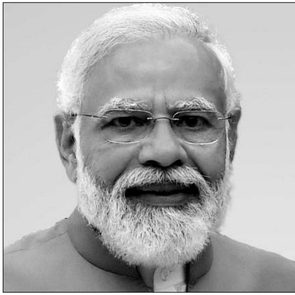
प्रधानमंत्री नरेन्द्र मोदी

महान समाज सुधारक महात्मा फुले का जीवन नैतिक साहस, आत्म चिंतन और समाज के हित के लिए अटूट समर्पण का प्रेरक उदाहरण है