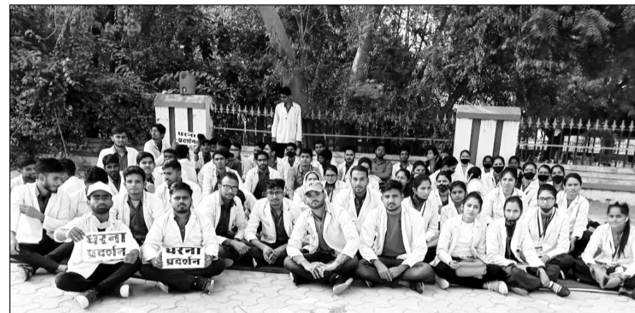
चूरू नर्सिंग कॉलेज के विद्यार्थी अपनी मांगों को लेकर धरने बैठे।

राज्य सरकार के मंत्रियों, विधायकों को कई बार अवगत करवाने के बावजूद आज तक किसी के कानों में जूँ तक नहीं रेंगी। इन परेशानियों को देखते हुये विद्यार्थियों को