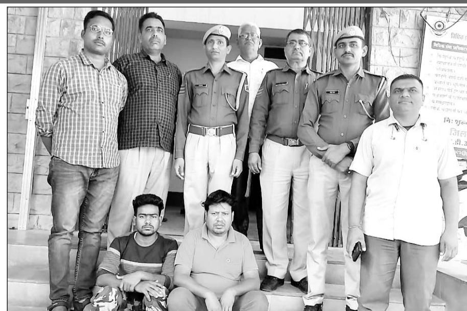
बाड़मेर में कोतवाली पुलिस ने सोना चोरी के मामले में दो आरोपियों को गिरफ्तार किया।