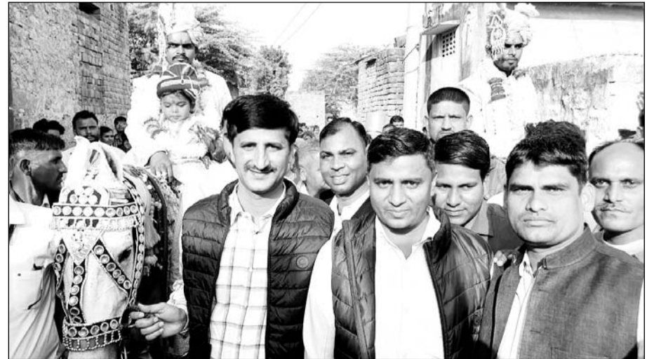
पंचायत कैरोडी में निकासी निकालते लोग।