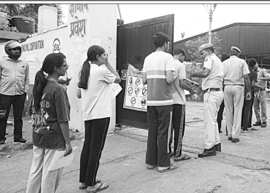
नीट परीक्षा देने पहुंचे अभ्यर्थियों को परीक्षा केंद्र में प्रवेश देने से पूर्व पुलिस ने उनकी गहनता से जांच की।

-कार्यालय संवाददाता- जयपुर। राष्ट्रीय पात्रता सह प्रवेश परीक्षा (नीट-यूजी) की पुनः परीक्षा रविवार को राजधानी जयपुर में कड़े सुरक्षा प्रबंधों और प्रशासनिक निगरानी के बीच शांतिपूर्ण एवं सुव्यवस्थित ढंग से संपन्न हुई। जयपुर जिले के 103 परीक्षा केंद्रों पर आयोजित परीक्षा में 37128 अभ्यर्थी पंजीकृत थे। जिनमें से 34031 अभ्यर्थी उपस्थित रहे, जबकि 3,097 अनुपस्थित रहे। इस प्रकार कुल उपस्थित 91.66 प्रतिशत दर्ज की गई। परीक्षा दोपहर 2 बजे शुरू होकर शाम 5:15 बजे समाप्त हुई। नेशनल टेस्टिंग एजेंसी (एनटीई) ने अभ्यर्थियों को 15 मिनट का अतिरिक्त समय दिया। परीक्षा समाप्त होने के बाद 22 गोदाम सिकल, परकोटा क्षेत्र के प्रमुख बाजारों तथा शहर के कई व्यस्त मार्गों पर परीक्षाार्थियों और उनके परिजनों की भीड़ उमड़ने से यातायात व्यवस्था प्रभावित नहीं और कई स्थानों पर वाहन रंगते नजर आए। परीक्षा की संवेदनशीलता को देखते हुए इस बार अभूतपूर्व सुरक्षा व्यवस्था की गई थी। अभ्यर्थियों को परीक्षा केंद्र में प्रवेश से पहले श्री-लेयर सिक्वोरिटी जांच से