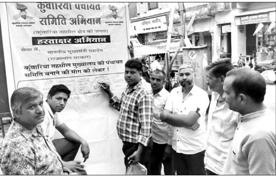
कुंवारिया को पंचायत समिति की बनाने की मांग को लेकर चलाए गए हस्ताक्षर अभियान के दौरान पोस्टर पर हस्ताक्षर करते ग्रामीण।

उपेक्षा करना आम जनता के साथ छलावा करने के समान है। कार्यकर्ताओं ने हस्ताक्षर करते हुए बताया कि कुंवारिया में तहसील कार्यालय, पुलिस थाना, सीएनसी, ब्रॉडगेज, फोरलेन की कनेक्टिविटी सहित मूलभूत सुविधाएं उपलब्ध होने के बाद भी उपेक्षा की जा रही है वो सरासर गलत है। क्षेत्र के कई कार्यकर्ताओं ने कुंवारिया तहसील