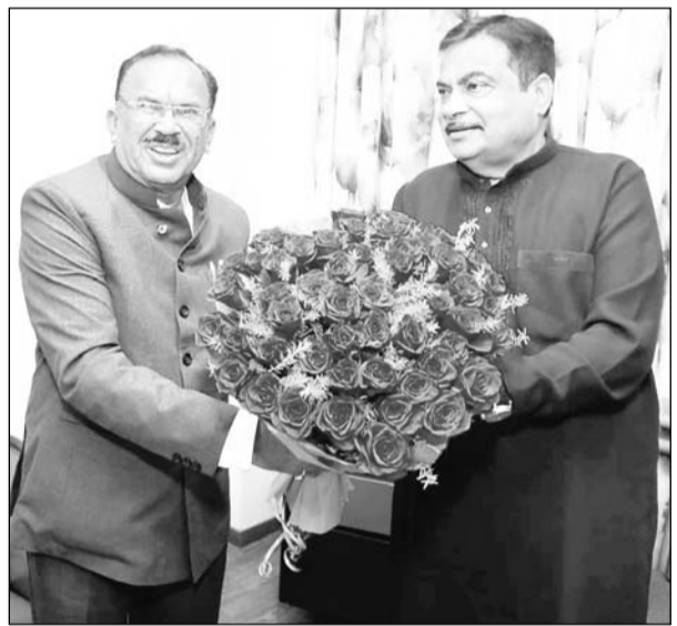
राजस्थान विधानसभा अध्यक्ष वासुदेव देवनानी ने शनिवार को नागपुर में राष्ट्रीय पर्यावरण युवा सप्ताह 2024 के उद्घाटन समारोह को संबोधित कर रहे थे। देवनानी ने कहा कि राजस्थान में अमृता देवी ने पेड़ों की रक्षा के लिए अपने प्राणों की आहुति दी थी। के एम मुंशी ने 1950 में पेड़ लगाकर वन महोत्सव शुरू किया। आज हर व्यक्ति पेड़ लगाए और उसका संरक्षण करें तो पर्यावरण संतुलित रहेगा और मानव जीवन सुरक्षित रहेगा। देवनानी ने कहा युवा नेतृत्व को सामाजिक भागीदारी निधाने के लिए आगे आना है। राष्ट्र के समावेशी विकास में योगदान देना है। युवाओं को अपना लक्ष्य तय करना है। योजना बनानी है। राष्ट्र के विकास को दिशा भी देनी है। उन्होंने कहा कि आज के दौर में युवाओं की जिम्मेदारी बढ़ रही है। युवा हर क्षेत्र में अपने आप को साबित करें। युवा उठे और आगे बढ़ता रहे तो समाज का निरंतर विकास होता रहेगा। देवनानी ने कहा युवा राष्ट्र के भविष्य की आशा की किरण है।

जयपुर। विधानसभा अध्यक्ष वासुदेव देवनानी ने कहा है कि प्रकृति जीवन दायिनी है, इसकी रक्षा करना हम सभी का कर्तव्य है। हम सभी को मिलकर पर्यावरण का संरक्षण करना है। देश का भविष्य आज का युवा है। उसके कंधों पर जिम्मेदारी है। यदि युवा किसी कार्य को पूरा करने की ठान ले तो सब कुछ संभव हो सकता है। देवनानी ने युवाओं का आवाहन किया वे विकसित भारत की कल्पना को साकार करें और पर्यावरण का संरक्षण करने में अपना योगदान दें।