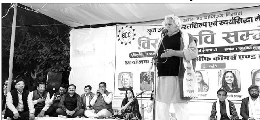
भरतपुर के हाट कम्पनी बाग में चल रहे ब्रज उद्योग-हस्तशिल्प मेले में कवियों ने अपनी कविताएं प्रस्तुत की।