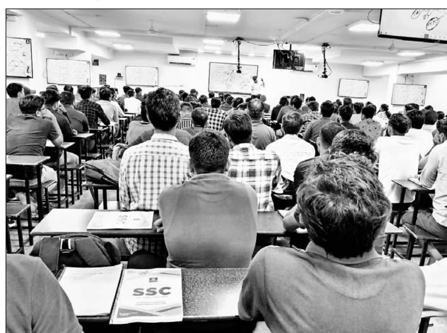
उत्कर्ष क्लासेस द्वारा जयपुर व जोधपुर में एस.एस.सी. (सीजीएल) की तैयारी कर रहे अभ्यर्थियों के लिए काउंसलिंग सेमिनार के साथ ही स्कॉलरशिप टेस्ट आयोजित किए गए।

जोधपुर, (कासं)। उत्कर्ष क्लासेस द्वारा रविवार को राजस्थान के 2 बड़े शहरों जयपुर व जोधपुर में एसएससी (सीजीएल) की तैयारी कर रहे अभ्यर्थियों के लिए काउंसलिंग सेमिनार के साथ ही स्कॉलरशिप टेस्ट आयोजित किए गए।