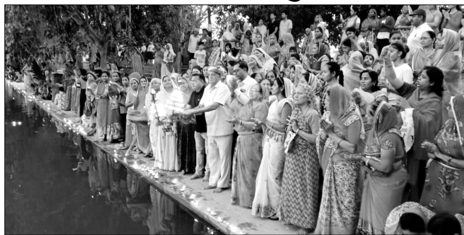
पाली में महिला मंडल व लोगों ने लखोटिया सरोवर आरती की गई।