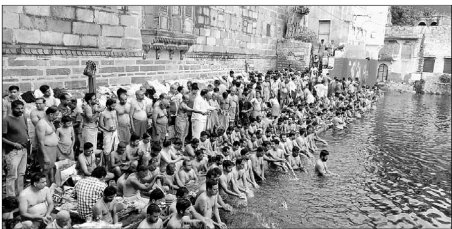
जोधपुर शहर के जलाशयों पर सामूहिक तर्पण करने के लिए लोगों की भीड़ रही।

जोधपुर, (कासं)। श्राद्ध पक्ष के अंतिम दिन सर्वपितृ अमावस्या पर आज जोधपुर शहर के सभी जलाशयों पर सुबह से ही सामूहिक तर्पण करने के लिए लोगों की भीड़ उमड़ पड़ी। पितरों की आत्मा की शांति के लिए तर्पण व पिंडदान किया गया।