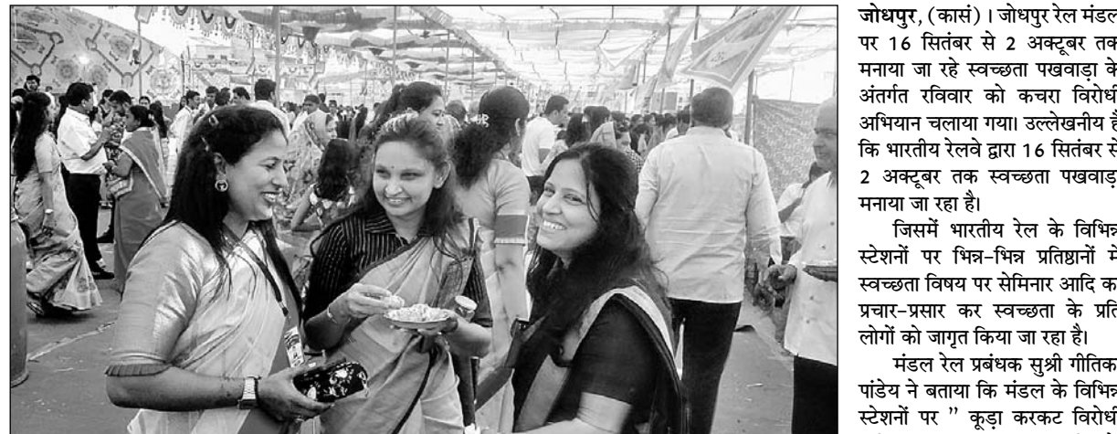
पाली शहर के अनुव्रत मैदान पर जैन स्नेह मिलन मेला व क्षमा याचना पर्व मनाया।

पाली, (नि.सं.)। पाली शहर के अनुव्रत मैदान पर जैन युवा संगठन की ओर से रविवार को जैन स्नेह मिलन मेला व क्षमा याचना पर्व धूमधाम से मनाया गया। इस वर्ष रजत जयंती वर्ष होने के कारण मेला भव्य रूप में आयोजित हुआ। जहाँ अनुव्रतनगर मैदान में