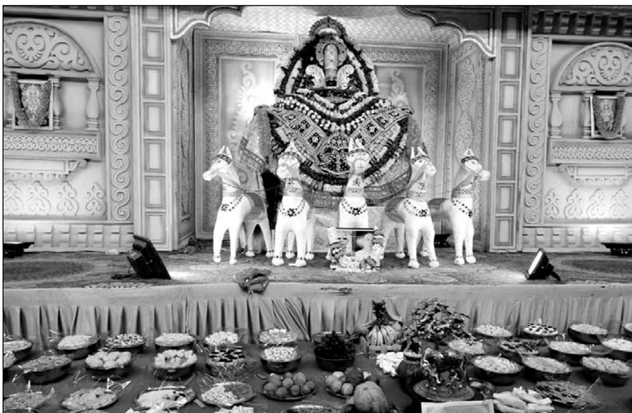
पाली शहर की अग्रसेन वाटिका में जयपुर से मंगाए रंग बिरंगे आकर्षक पुष्पों से खाटू श्याम की भव्य झांकी सजाई गई।

पाली, (नि.सं.)। अग्रसेन जयंती समारोह के तहत अग्रसेन वाटिका में एक शाम खाटू श्याम के नाम भव्य भजन संध्या का आयोजन किया गया। इस अवसर पर जयपुर से मंगाए रंग बिरंगे आकर्षक पुष्पों से खाटू श्याम की भव्य झांकी सजाई गई। श्याम