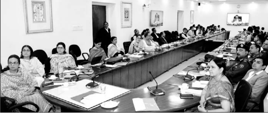
आगामी लोकसभा और राज्य विधानसभा चुनावों के मद्देनजर, भारत निर्वाचन आयोग ने सोमवार को राज्यों/केंद्र शासित प्रदेशों में तैनात किए जाने वाले पर्यवेक्षकों के लिए एक ब्रीफिंग का आयोजन किया।

जयपुर, (का.सं.)। आगामी लोकसभा और राज्य विधानसभा चुनावों के मद्देनजर, भारत निर्वाचन आयोग ने आज राज्यों/केंद्रशासित प्रदेशों में तैनात किए जाने वाले पर्यवेक्षकों के लिए एफ बीफिंग का आयोजन किया। इसमें 2150 से अधिक वरिष्ठ आईएएस, आईपीएस अधिकारियों के साथ-साथ भारतीय राजस्व सेवा और कुछ अन्य केंद्रीय सेवाओं के अधिकारियों ने भाग लिया। बैठक नई दिल्ली के विज्ञान भवन में हाइब्रिड मोड में आयोजित की गई थी, जिसमें कुछ अधिकारी संबंधित राज्य/केंद्र शासित प्रदेश के मुख्य निर्वाचन अधिकारी कार्यालयों से व्चूअली शामिल हुए। आगामी चुनाव में लगभग 900 सामान्य पर्यवेक्षक, 450 पुलिस पर्यवेक्षक और 800 व्वय पर्यवेक्षक तैनात किये जा रहे हैं। राजस्थान में आज 85 पर्यवेक्षकों ने इस ब्रीफिंग सत्र में व्चूअली भाग लिया। पर्यवेक्षकों को उनकी महत्वपूर्ण भूमिका की याद दिलाते हुए मुख्य चुनाव आयुक्त राजीव कुमार ने उन्हें स्वतंत्र, निष्पक्ष, समान अवसर सुनिश्चित करने के साथ ही भय और प्रलोभन मुक्त चुनाव कराने के निर्देश दिए। सीईसी