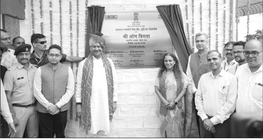
बून्दी में लोकसभा अध्यक्ष ओम बिरला ने पासपोर्ट केंद्र का शुभारम्भ किया।

कोटा, (निसं)। बून्दी में नागरिक सुविधाओं के विस्तार की दिशा में गुरुवार को एक महत्वपूर्ण उपलब्धि जुड़ गई। लोकसभा अध्यक्ष ओम बिरला ने नैनवा रोड स्थित प्रधान डाकघर में विदेश मंत्रालय की ओर से स्थापित पासपोर्ट सेवा केंद्र का शुभारंभ किया। इस केंद्र के प्रारंभ होने से अब बून्दी एवं आसपास के क्षेत्रों के नागरिकों को पासपोर्ट संबंधी कार्यों के लिए कोटा व जयपुर की यात्रा नहीं करनी पड़ेगी।