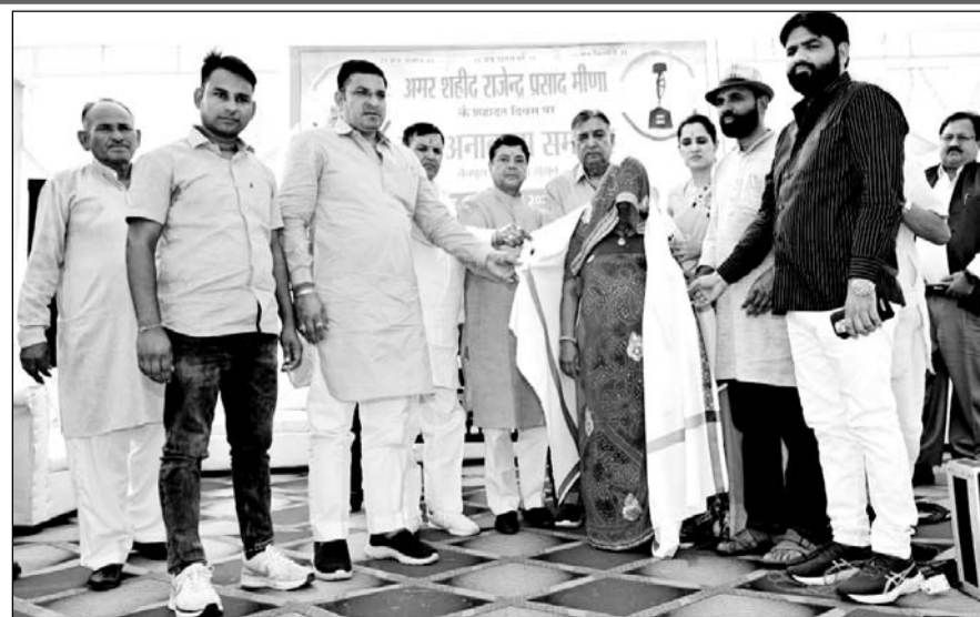
लादूसर ग्राम पंचायत के चैनपुरा गांव में आयोजित समारोह में विरंगना का सम्मान किया गया।