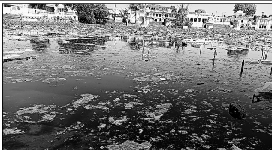
सांभर के देवयानी तीर्थ स्थल में साफ-सफाई का अभाव बना हुआ है।

घाटों के चारों ओर विभिन्न देवी देवताओं के अति प्राचीन मंदिरों के इतिहास का महाभारत व अन्य धार्मिक ग्रंथों में इसका उल्लेख भी है। इसके बावजूद इन ऐतिहासिक धरोहरों व मंदिरों के रखरखाव की दिशा में स्थानीय प्रशासन और सरकार पूरी तरह से नकारात्मक बनी हुई है। सरोवर में जलकुंभी ने अपना साम्राज्य बना लिया है। कुंड में बारिश के पानी के अलावा अन्य कोई स्रोत जल के आवन का नहीं है, ऐसी स्थिति में भीषण गर्मी का दौर शुरू होने ही लगातार जल स्तर का घटना चिंता का विषय है। सरोवर