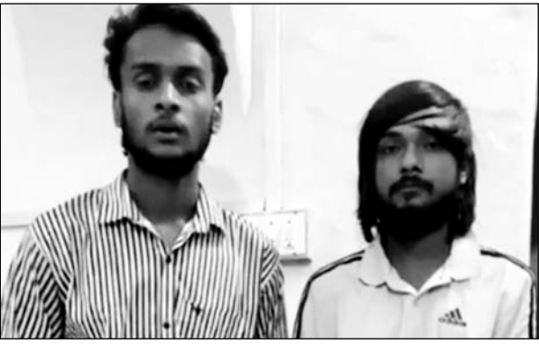
कार में आग लगाने वाले दो आरोपियों को पुलिस ने गिरफ्तार किया।