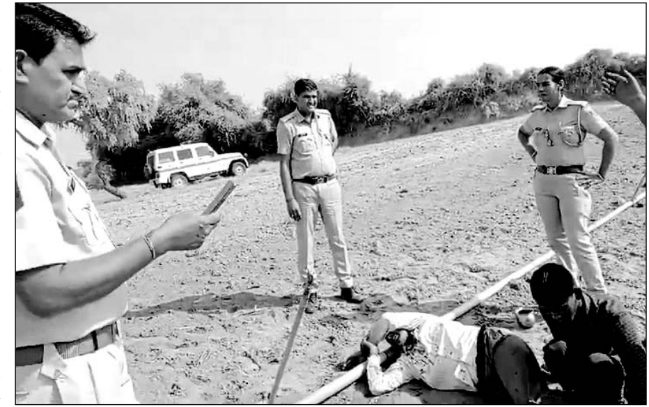
घटनास्थल का वीडियो सामने आया है, जिसमें खेत में एक व्यक्ति अचेत अवस्था पड़ा दिखाई दे रहा है।

गंभीर घायल को सूरजगढ़ के सरकारी अस्पताल में भर्ती करवाया, एक झुंझुं रेफर