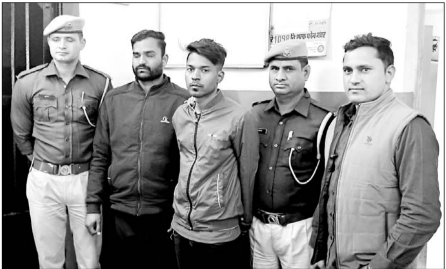
पुलिस ने आरोपियों को गिरफ्तार किया।

जुए की लत से कर्जदार बन गये थे दोनों युवक