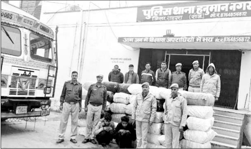
हनुमान नगर थाना पुलिस ने करोड़ों का गांजा बरामद कर तस्करों को गिरफ्तार किया।