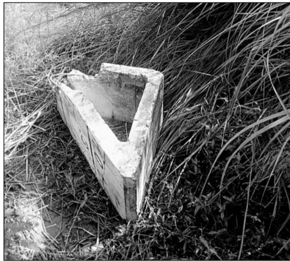
एक किमी के दायरे में दो जगह पर सीमेंट के ब्लॉक रखकर ट्रेन को बेपटरी करने की साजिश नाकाम हुई।

अजमेर के सराधना और बांगड़ ग्राम रेलवे स्टेशन के बीच दो स्थानों पर बदमाशों ने सीमेंट के 70 किलो वजनी ब्लॉक रख दिये