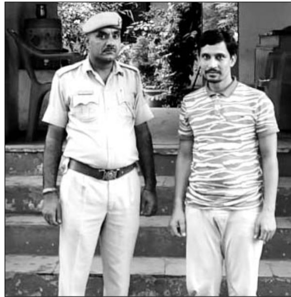
कुशलगढ़ थाना पुलिस ने अध्यापक भर्ती परीक्षा में डमी अभ्यर्थी बैठाकर चयन कराने वाले एजेंट को गिरफ्तार किया।