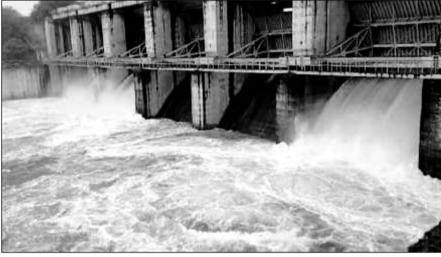
करौली जिले के सबसे बड़े बांध पांचना से पानी की निकासी की जा रही है।

करौली क्षेत्र में रुक-रुककर हो रही बारिश से पांचना बांध में भी पानी की आवक बढ़ी है। करौली जिला मुख्यालय पर करीब 3.4 एमएम (सवा इंच) बारिश दर्ज की गई है। करौली जिले में 15 जून से अब तक औसत से दोगुनी से अधिक बारिश दर्ज की जा चुकी है। जिले में करीब 1331.3 एमएम बारिश दर्ज हुई है जो औसत बारिश से दोगुनी से अधिक है। जिले में मानसून सत्र में बारिश का औसत 596 एमएम है। इसी तरह पांचना बांध कि कुल भराव क्षमता 2100 एमसीएफटी है, जबकि बांध से 7500 एमसीएफटी से अधिक पानी की निकासी हो चुकी है।