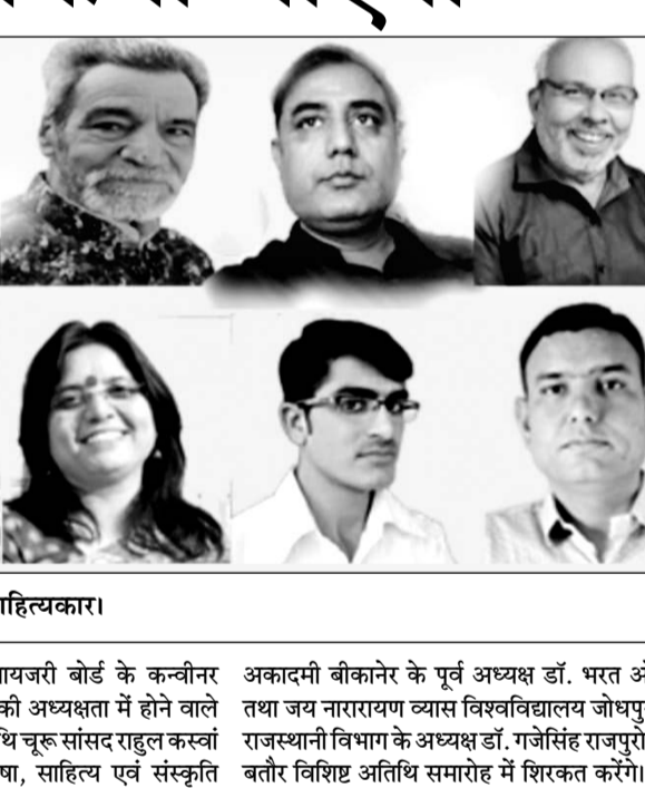
सम्मानित होने वाले साहित्यकार।