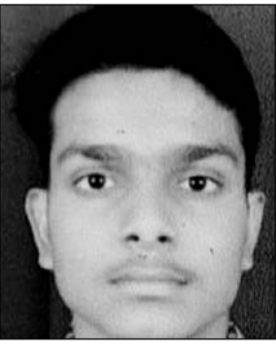
मृतक चचेरे भाई।