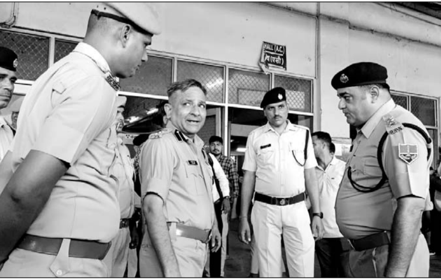
वारदात के बाद अजमेर रेलवे स्टेशन का जीआरपी एएसपी ने मौका मुआयना किया।

अजमेर, (कास)। अजमेर रेलवे स्टेशन पर मासूम बच्चियों के अपहरण और दुराचार की बारदातें धमके का नाम नहीं ले रही हैं। मंगलवार देर रात ऐसा ही एक मामला सामने आया, जब अजमेर स्टेशन के प्लेटफार्म नंबर संख्या एक से 4 साल की मासूम बालिका अपहरण हो गया। बालिका का परिवार सिरोही से दरगाह जियारत के लिए अजमेर आया था और गंतव्य स्थान पर जाने के लिए स्टेशन के प्लेटफार्म पर ट्रेन का इंतजार कर रहा था। घटना के बाद जीआरपी, आरपीएफ और रेलवे अधिकारियों ने तत्परता दिखाते हुए आरोपी को दस घंटे के अंदर अहमदाबाद के चांदोलिया रेलवे स्टेशन पर पोरबंदर एक्सप्रेस से गिरफ्तार कर लिया और बच्ची को सुरक्षित कब्जे में ले लिया। आरोपी को पुलिस टीम देर अजमेर लेकर आई।