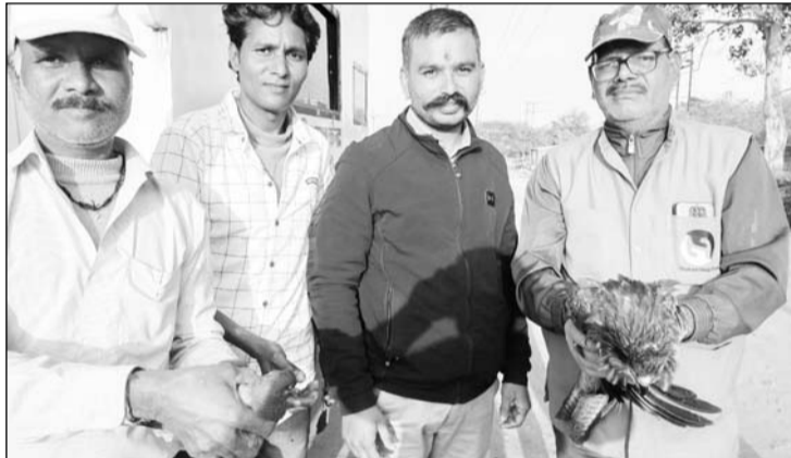
कोटा में डॉक्टर की मदद करते पक्षी प्रेमी।