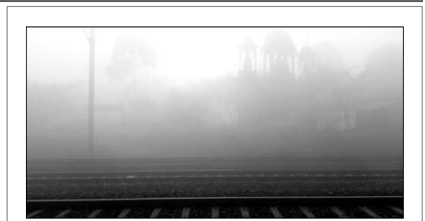
श्रीमाधोपुर में महज 10 मीटर की दूरी की इश्टया रही।

बीकानेर, (कासं)। एक बार फिर सर्दी ने जोर पकड़ लिया है। बीती रात बीकानेर के ग्रामीण क्षेत्रों में जहां भी पानी खुले में रहा, वहां बर्फ जम गई। कारों पर ओस का पानी बर्फ में बदल गया तो फसलों पर भी सुबह बर्फ ही बर्फ नजर आई। तापमान में गिरावट के चलते टिड्डुरन बड़ गई है और जनजीवन पूरी तरह प्रभावित है।