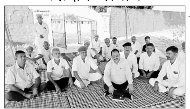
बाप में धरना स्थल पर ग्रामीणों से सीबीईओ ने वार्ता की।

बाप, (निसं)। धोलिया स्थित राजकीय माध्यमिक विद्यालय में रिक्त पद भरने की मांग को लेकर किया जा रहा तालाबंदी आंदोलन व धरना प्रदर्शन पांचवे दिन सोमवार सुबह समाप्त हो गया।