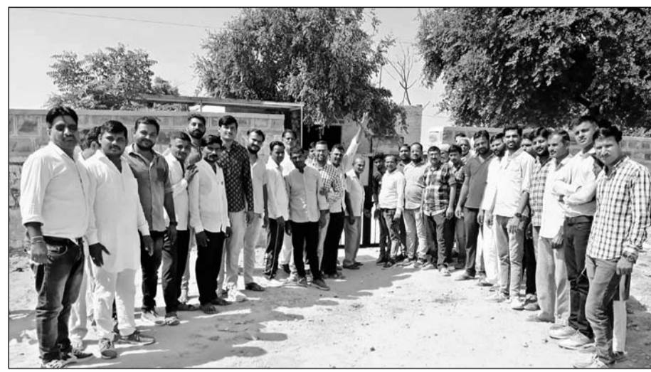
आम पशुपालक को सुविधा नहीं मिलने से क्षुब्ध गो पुत्र सेना ने धरना-प्रदर्शन किया।

बाप, (निसं)। जोधपुर जिले के बाप कस्बे में संचालित प्रथम श्रेणी राजकीय पशु चिकित्सालय में एक भी पशु चिकित्सक नहीं है। स्वीकृति 7 पदों में से पांच रिक्त पड़े हैं। अभी अस्पताल महज एक पशु परिचर के भरोसे ही है। इस कारण लंबी स्किन जैसी भयंकर बीमारी में बीमार गोवंश को उपचार नहीं मिल पाया। हजारों गोवंश काल कलवित हो गया। बीमारी की भयावता अभी भी जारी है। पशुओं के अंग सड़ने लगे हैं। कीड़े तक पड़ गए हैं। सरकारी पशु चिकित्सालयों में किसी प्रकार की आम पशुपालक को सुविधा नहीं मिलने से क्षुब्ध गो पुत्र सेना ने पूर्व सूचना अनुसार सोमवार को बाप में संचालित प्रथम श्रेणी पशु चिकित्सालय के मुख्य द्वार पर ताला जड़कर अनिश्चितकालीन धरना शुरू कर दिया।