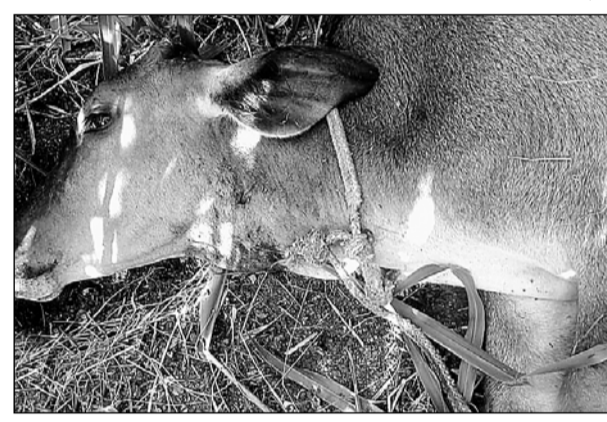
मृत गोवंश के गले में नाखूनों के लगे निशान।