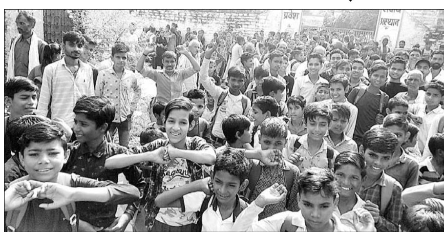
बसेड़ी की नादनपुर स्कूल में ग्रामीणों व विद्यार्थियों ने विद्यालय के गेट पर ताला लगाकर प्रदर्शन किया।

नादनपुर, (निसं)। बसेड़ी इलाके के नादनपुर स्कूल में सोमवार को ग्रामीणों व विद्यार्थियों ने विद्यालय के गेट पर ताला जड़कर जमकर विरोध प्रदर्शन किया।