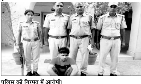
पुलिस की गिरफ्तार में आरोपी।