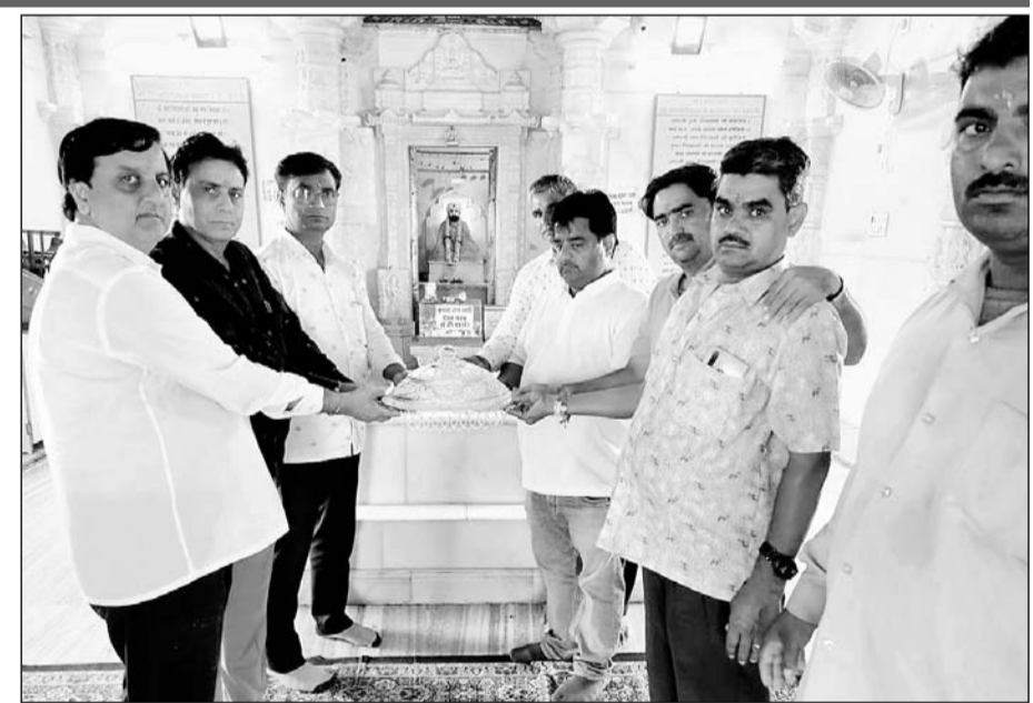
श्रद्धालुओं ने अमरपुरा स्थित समाधि स्थल पर एक किलो से अधिक चांदी का छत्र समर्पित किया।