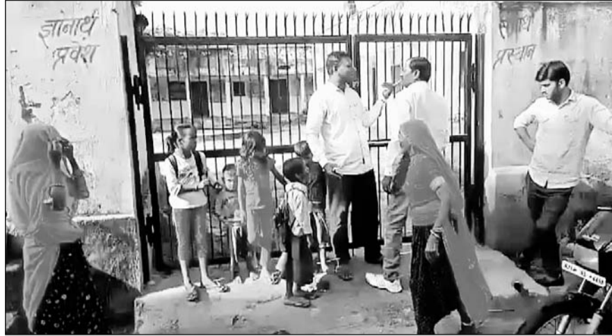
चाकसू उपखंड के खेडा जगन्नाथपुर में ग्रामीणों ने स्कूल के मेन गेट पर ताला जड़ प्रदर्शन किया।

मामला उपखंड क्षेत्र के अंतर्गत कोटखावदा तहसील की ग्राम पंचायत बड़ोदिया के ग्राम खेडा जगन्नाथपुरा स्थित उच्च प्राथमिक विद्यालय का है जहां समय पर शिक्षकों के विद्यालय में नहीं आने एवं पास के कुएं में खाली शराब की बोतलें मिलने से गुस्सा ग्रामीणों ने स्कूल के मेन गेट पर ताला जड़ दिया तथा धरना प्रदर्शन करने लगे। इसके साथ ही स्कूल में बच्चों के साथ अध्यापकों को भी अंदर नहीं जाने दिया। इस पर शिक्षकों ने ग्रामीणों को विश्वास दिलाया कि वह अब समय से स्कूल में आएंगे तब जाकर ग्रामीणों ने ताला खोला। ग्रामीणों का आरोप है कि विद्यालय के शिक्षक समय पर नहीं आते हैं इस पर उन्होंने