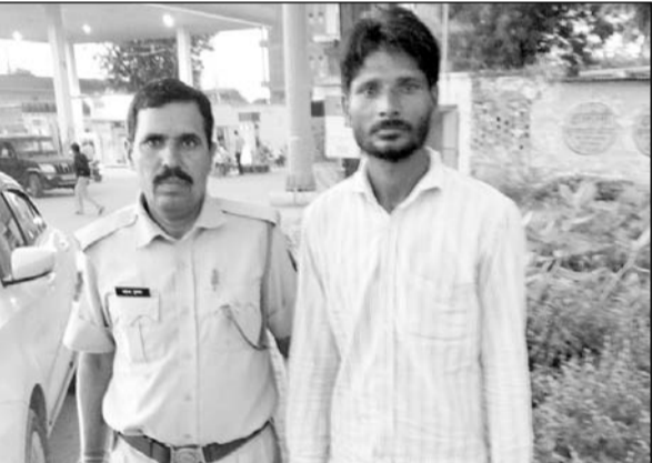
राजगढ़ थाना पुलिस ने आरोपी को हनुमानगढ़ जिले के रावतसर से गिरफ्तार किया।