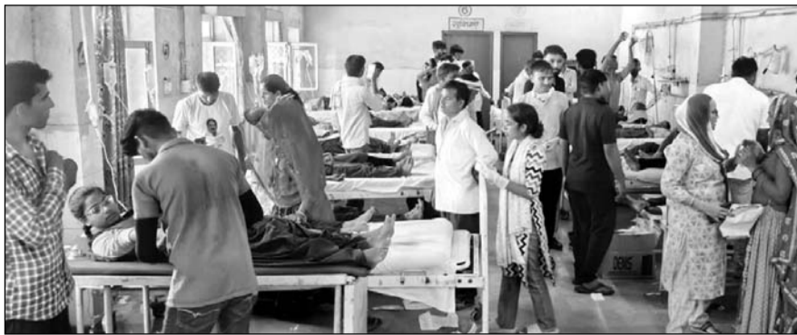
विषाक्त पोषाहार के सेवन से बीमार बालक-बालिकाओं को अस्पताल में भर्ती कराया।

प्राप्त जानकारी के अनुसार राजकीय उच्च माध्यमिक विद्यालय चूडियावास में 156 बालक-बालिकाओं के लिए शनिवार को पोषाहार में आलू की सब्जी व चपाती बनाई गई थी। पोषाहार खाने के बाद