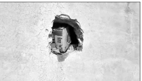
चोरों ने वाइन शॉप के पीछे से दीवार तोड़कर छेद कर वारदात की।

भीलवाड़ा, (निसं)। ऐसे चोर और ऐसे चोरी अपने देखी नहीं होगी, जहां चोरों ने पहले तस्ली से बैठकर शराब पी और 10 लाख के माल पर हाथ साफ कर गए। ये हैरान करने वाली चोरी की वारदात मानसरोवर झील के पास स्थित वाइन शॉप की है। सुनसान जगह होने के कारण चोर देर रात आए। पहले वाइन शॉप के पीछे से दीवार तोड़कर छेद किया, जिससे अंदर जाया जा सके। चोर अंदर गए, वहां बैठकर शराब पी। फिर