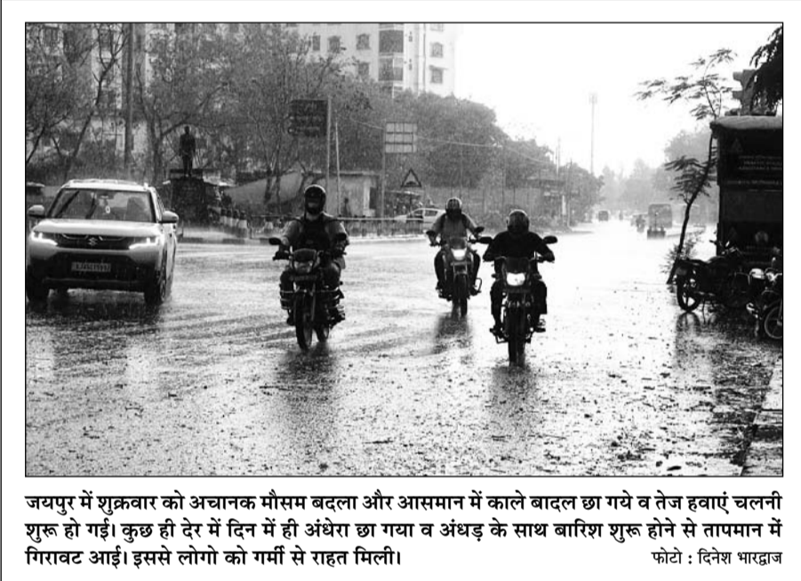
जयपुर में शुक्रवार को अचानक मौसम बदला और आसमान में काले बादल छा गये व तेज हवाएं चलनी शुरू हो गईं। कुछ ही घंटों में ही अंधेरा छा गया व अंधड़ के साथ बारिश शुरू होने से तापमान में गिरावट आई। इससे लोगों को गर्मी से राहत मिली।

ही है। इसके कारण जल वितरण संबंधी परिसंपत्तियों की गुणवत्ता में कमी आकर, उसके कार्यशीलता पर भी कुप्रभाव पड़ता है। जलदाय मंत्री ने बताया कि राज्य सरकार द्वारा पेयजल की दरों को वास्तविक लागत के आधार पर तर्कसंगत बनाने का निर्णय लिया गया है। इस कारण पानी की वर्तमान दरों को चार गुणा करने की सहमति वित्त विभाग से प्राप्त होने पर दरों में वृद्धि की जा रही है। उसके बावजूद भी राज्य की जनता पर अतिरिक्त भार नहीं डालने के उद्देश्य से राज्य सरकार द्वारा जनहित में निर्णय लिया गया है कि पेयजल उपभोक्ताओं से वर्तमान लागू दरों पर ही पानी के बिलों एवं अन्य सेवाओं की राशि वसूल की जाएगी।