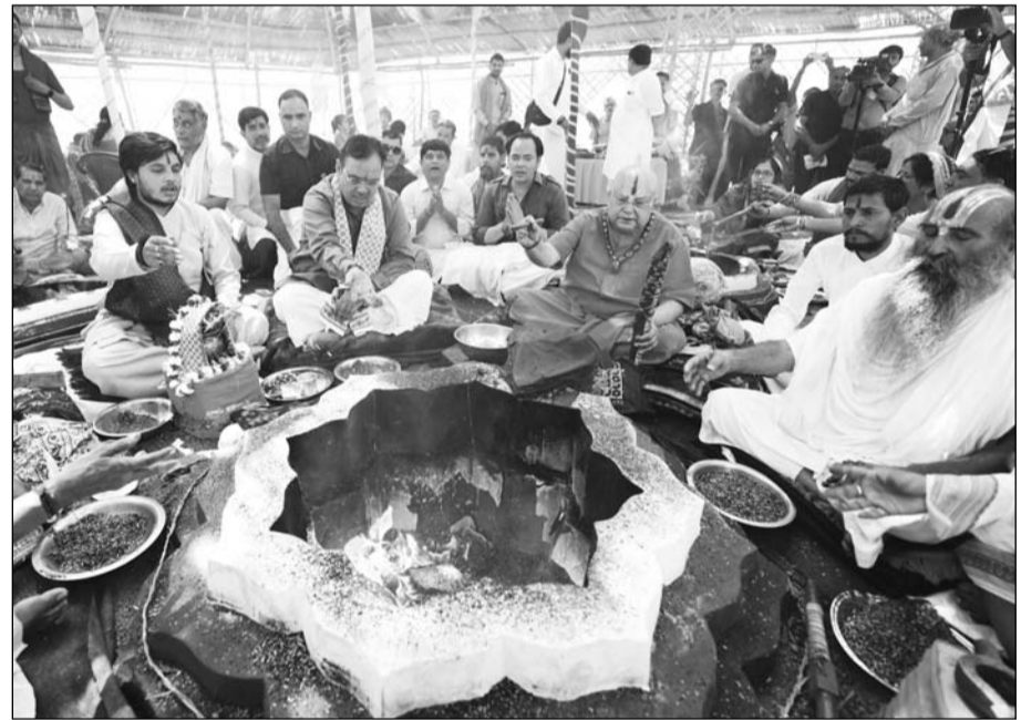
मुख्यमंत्री भजनलाल शर्मा ने शुक्रवार को न्यू सांगानेर रोड स्थित श्री चिंताहरण काले हनुमानजी मंदिर में एकादश कुंडात्मक श्री हनुमत महायज्ञ में आहुति दी तथा प्रदेशवासियों की सुख-समृद्धि और खुशहाली की कामना की।

जयपुर। मुख्यमंत्री भजनलाल शर्मा शुक्रवार को न्यू सांगानेर रोड स्थित श्री चिंताहरण काले हनुमानजी मंदिर पहुंचे। यहां उन्होंने एकादश कुंडात्मक सात दिवसीय श्री हनुमत महायज्ञ में शामिल