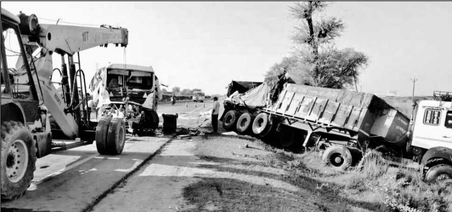
राष्ट्रीय राजमार्ग 52 पर दुर्घटनाग्रस्त ट्राले।