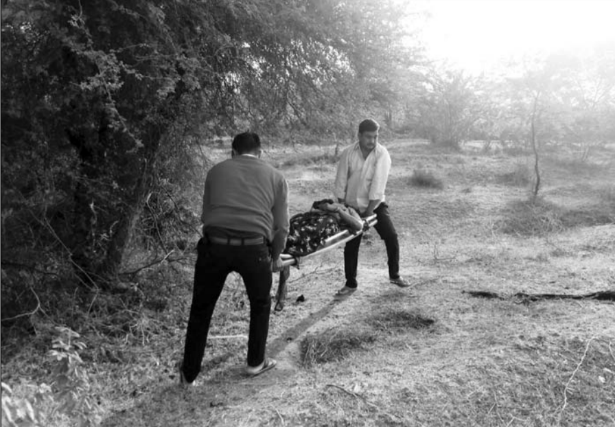
108 के चालक व कपांडर शव को ले जाते हुए।

हत्या को दुर्घटना का मोड देना चाहता था आरोपी पति