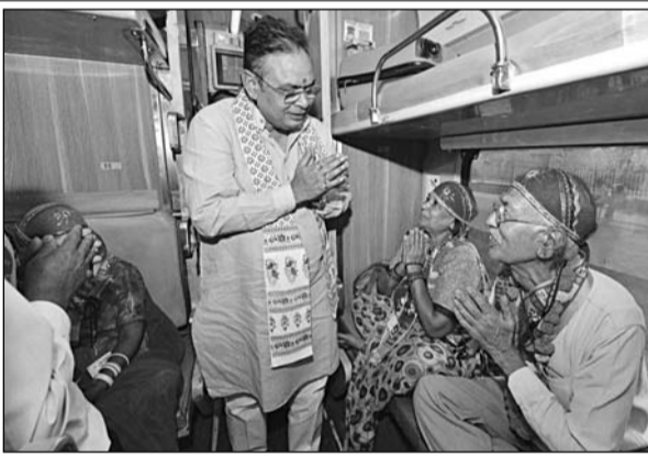
मुख्यमंत्री भजनलाल शर्मा ने दुर्गापुरा रेलवे स्टेशन से सोमनाथ तीर्थ स्थल के लिए ट्रेन को रवाना किया। इस दौरान वृद्धजनों ने मुख्यमंत्री भजनलाल शर्मा का आभार जताया।

जयपुर। मुख्यमंत्री भजनलाल शर्मा ने कहा कि राज्य सरकार वृद्धजनों के कल्याण एवं धार्मिक पर्यटन को विकसित करने के लिए संकल्पित होकर कार्य कर रही है। इसी कड़ी में वरिष्ठ नागरिक तीर्थ यात्रा योजना बुजुर्गों की तीर्थाटन की मनोकामना को पूरा करने का माध्यम बन रही है। इस योजना के माध्यम से एक लाख से अधिक वरिष्ठ नागरिकों की विभिन्न तीर्थस्थलों के दर्शन की अभिलाषा पूरी हो चुकी है। मुख्यमंत्री शुक्रवार को दुर्गापुर रेलवे स्टेशन पर सोमनाथ यात्रा शुभारंभ समारोह को संबोधित कर रहे थे।