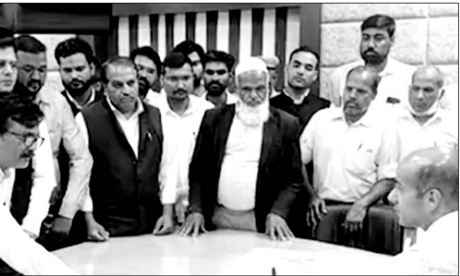
अजमेर में वकीलों ने जिला कलेक्टर को जापन सौंपकर मारपीट करने वालों के खिलाफ कार्यवाही की मांग की।

■ कलेक्टर, एसपी व डीएसओ को साँपा जापन, ढाबा संचालक के खिलाफ कार्रवाई की मांग