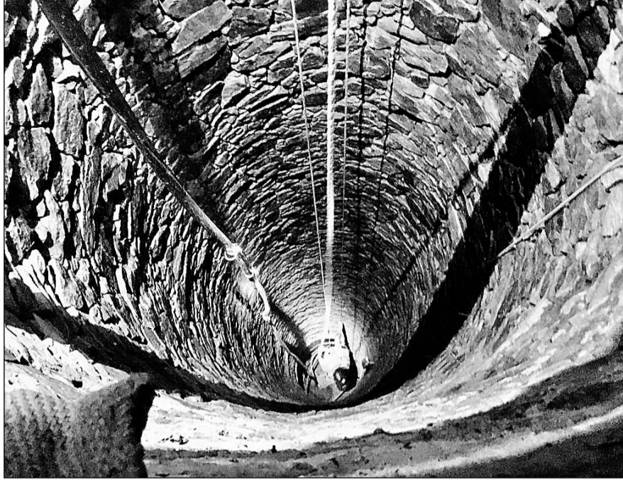
रूपनगढ़ : एसडीआरएफ टीम ने स्ट्रेचर पर बांध कर कुएं से महिला के शव को बाहर निकाला।