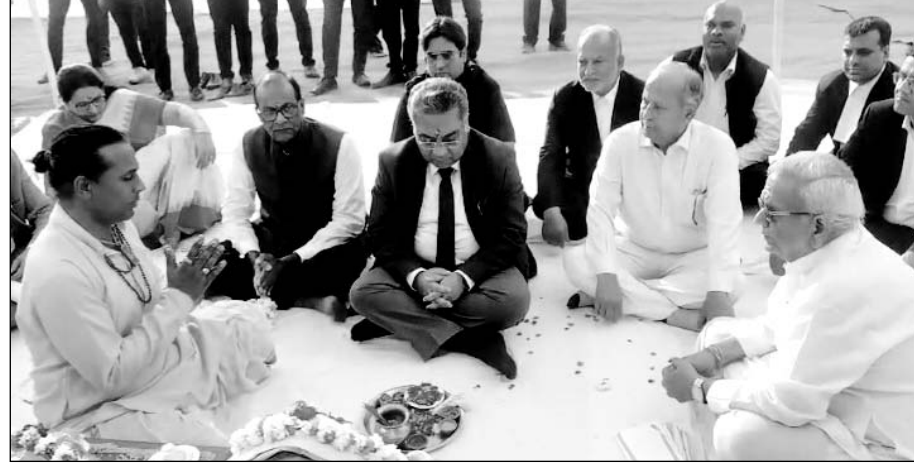
मुख्य न्यायाधीश एम.एम. श्रीवास्तव बुधवार को फैमिली कोर्ट के अलग भवन के लिए आयोजित भूमि पूजन समारोह में शामिल हुए।

जयपुर, (का.सं.)। राजस्थान हाईकोर्ट के मुख्य न्यायाधीश एमएम श्रीवास्तव ने कहा कि फैमिली कोर्ट पारिवारिक मामलों के निस्तारण के लिए बने हैं। यहां की प्रक्रिया अन्य न्यायालयों से अलग होती है। यहां वकील, काउंसलर और जज पक्षकारों में सुलह का प्रयास करते हैं। इन अदालतों में बच्चों की अभिरक्षा के मामले भी आते हैं। जिसके चलते इन अदालतों में परिवार के लोग भी आते हैं। ऐसे में फैमिली कोर्ट का भवन न केवल अच्छा हो, बल्कि आने वाले परिवार के लोगों के बैठने के लिए भी समुचित व्यवस्था होनी चाहिए। इसलिए फैमिली कोर्ट का अपना अलग से भवन भी होना चाहिए। सीजे श्रीवास्तव बुधवार को फैमिली कोर्ट के अलग भवन के लिए आयोजित भूमि पूजन समारोह में उपस्थित वकीलों सहित अन्य लोगों को संबोधित कर रहे थे।