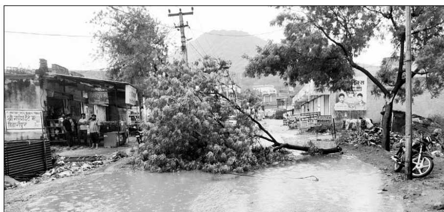
पाटन सहित आसपास में तेज रफ्तार हवाओं ने सैकड़ों पेड़ों को धराशायी कर दिया।

कुछ इलाकों में दीवारों भी आंधी के दबाव से दरक गईं। दुकानदारों का कहना है कि उनके प्रतिष्ठानों में रखे सामान को भी नुकसान हुआ है, वहीं ग्रामीण क्षेत्रों में कई कच्चे मकान आंधी की चपेट में आकर क्षतिग्रस्त हो गए। बिजली विभाग के कर्मचारियों ने मौके पर पहुंचकर