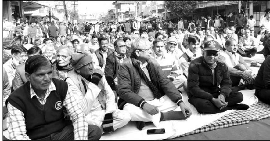
जिला बनाओ संघर्ष समिति ने नीमकाथाना के रामलीला मैदान में मिटिंग बुलाई।

पाटन, (निसं) राजस्थान सरकार द्वारा हाल ही में नवगठित जिलों के लिए किए गये निर्णयों में नीमकाथाना सहित नौ जिलों को हटाने के बाद पूरे नवगठित जिलों सहित नीमकाथाना में आमजन में आक्रोश देखने को मिला है। जिला बनाओ संघर्ष समिति ने अपना बैनर अब जिला बचाओ संघर्ष समिति में आभोजन में आक्रोश देखने को मिला है। जिला बनाओ संघर्ष समिति ने अपना बैनर अब जिला बचाओ संघर्ष समिति में आभोजन में आक्रोश देखने को मिला है। जिला बनाओ संघर्ष समिति ने अपना बैनर अब जिला बचाओ संघर्ष समिति में आभोजन में आक्रोश देखने को मिला है।