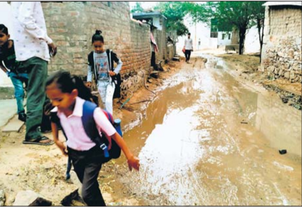
वार्ड 34 में बनी सीसी सड़क पर पानी भरने से ग्रामीण निकल नहीं पा रहे हैं।

पालिका क्षेत्र के शील की डूंगरी (शीतला माता) वार्ड नंबर 34 इलाके में बनी सीसी सड़क पर पानी भरने से ग्रामीण नहीं निकल पा रहे हैं। गांव का प्रमुख रास्ता होने के कारण यह रास्ता शीतला माता के दर्शन के लिए भी जाता है वहीं घरों में जाने के लिए भी लोगों को कीचड़ भर पानी में होकर ही जाना पड़ता है। टॉक रोड मुख्य मार्ग से अंदर जाने वाले इस उपरोक्त रास्ते पर नगर पालिका प्रशासन ने सीसी सड़क तो बनाई है, लेकिन पानी निकासी का इंतजाम नहीं किया, जिस कारण रास्ता