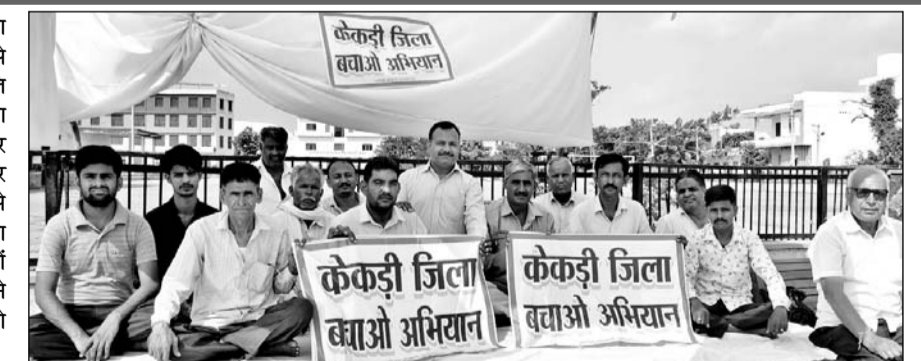
केकड़ी जिले को यथावत रखने की मांग को लेकर धरना जारी रहा।

केकड़ी, (नि.सं.)। केकड़ी से जिले का दर्जा छीनने की कयासों के बाद से केकड़ी में हर वर्ग में सरकार के प्रति आक्रोश व्याप्त हो गया है। जिला बचाओ अभियान के तहत बार एसोसिएशन के आह्वान पर लगातार दूसरे दिन केकड़ी कस्बा पूरी तरह से बंद रहा। बार एसोसिएशन के दर्जनों व्यापारिक व सामाजिक संगठनों ने समर्थन दिया है जिससे जिला बचाओ आन्दोलन तेजी बढ़ रहा है।