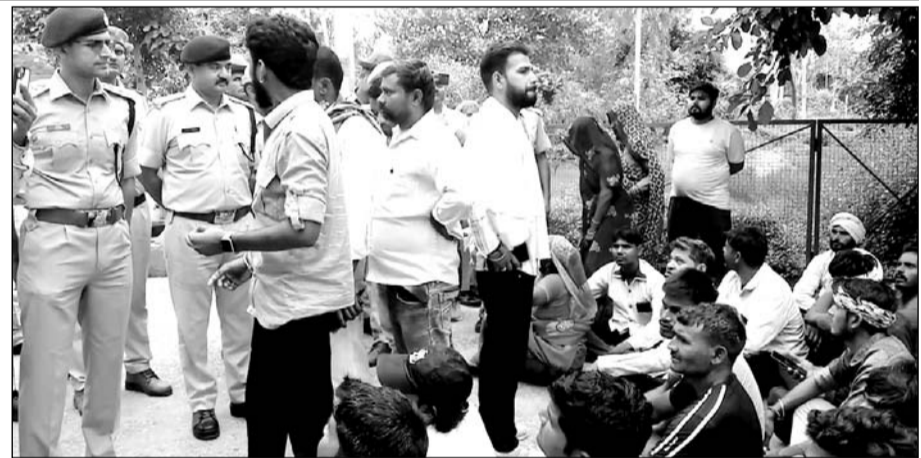
गांव जया में ट्रैक्टर से कुचलने से एक बालक की मौत के बाद परिजनों एवं ग्रामीणों ने प्रदर्शन किया।