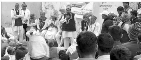
ग्राम पंचायत सेंट में चोपाल-नुककड सभा आयोजित की गई।

चोपाल और नुककड सभा में बताया कि मनरेगा एक योजना नहीं अतिवृत्त प्रामोण अर्थव्यवस्था की एक जीवन्तरेखा है। महात्मा गांधी ग्रामीण रोजगार गारंटी अधिनियम यूपीए सरकार ने 2005 में लागू किया था यह एक अधिकार-आधारित कानून है जोकि प्रत्येक ग्रामीण को मजदूरी रोजगार की मांग का वैधानिक अधिकार देता है, जोकि अब यह योजना बनकर यह जायेगी। राज्य सरकार 15 दिन के