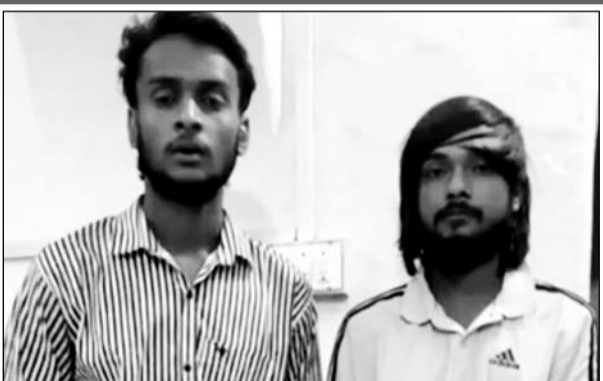
कार में आग लगाने वाले दो आरोपियों को पुलिस ने गिरफ्तार किया।