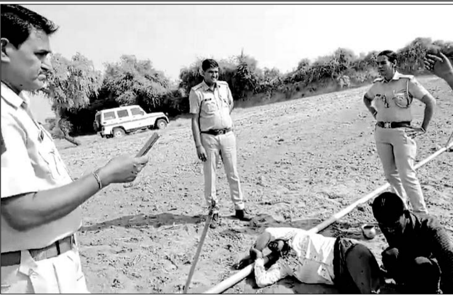
घटनास्थल का वीडियो सामने आया है, जिसमें खेत में एक व्यक्ति अचेत अवस्था पड़ा दिखाई दे रहा है।

गंभीर घायल को सूरजगढ़ के सरकारी अस्पताल में भर्ती करवाया, एक झुंझुं रेफर