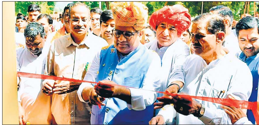
केंद्रीय वन एवं पर्यावरण मंत्री भूपेंद्र यादव ने ग्राम अहीरबास भडकोल के राजकीय उच्च माध्यमिक विद्यालय में कराए गए विभिन्न विकास कार्यों का फीता काटकर लोकार्पण किया।

बच्चों को अध्ययन करने में सुविधा मिलेगी। उन्होंने कहा कि विद्यालय में अध्ययन के साथ-साथ स्कूल डबलेपमेंट की कक्षाएं भी चलाई जाएं जिसेस तत्काली शिक्षा के प्रति बच्चों में रुचि जाग्रत हो सके। उन्होंने विद्यालय में निर्मित ई-लाईब्रेरी 50 हजार पुस्तकें उपलब्ध कराए जाने की घोषणा की। इस दौरान उन्होंने विद्यालय के विकास में सहयोग करने पर सहलग फाउंडेशन के प्रतिनिधियों को सम्मानित किया।