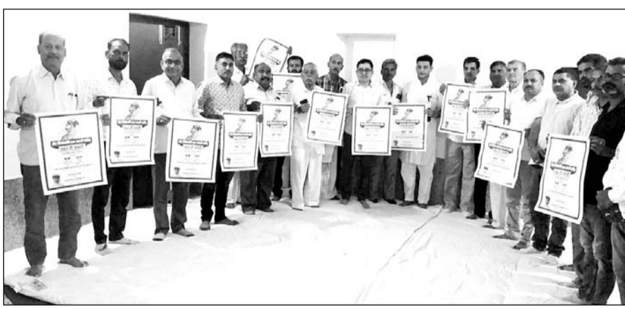
जैतारण में राव रतन सिंह स्मृति भवन में वीर शिरोमणि राव उदाजी राठौड़ की 562 वीं जयंती समारोह के पोस्टर का विमोचन किया।

जोधपुर, (का.सं.)। उदावत राठौड़ वंश के मूल पुरुष वीर शिरोमणि राव उदाजी राठौड़ की 562 वीं जयंती 25 नवंबर को प्रातः 10:15 बजे जैतारण तहसील के बिकरलाई गांव में समारोह पूर्वक आयोजित की जाएगी। समारोह के मुख्य अतिथि पूर्व मंत्री व पूर्व नेता प्रतिपक्ष राजेंद्र सिंह राठौड़ होंगे।