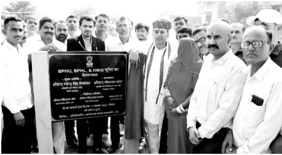
संसदीय कार्य, विधि एवं विधिक कार्य मंत्री जोगाराम पटेल ने सामुदायिक स्वास्थ्य केंद्र धवा में 80 लाख रुपए की लागत से बीपीएचयू, बीपीएचएल, एचएमआईएस यूनिट निर्माण कार्य का शिलान्यास किया।

पटेल ने कहा प्रदेश के स्वास्थ्य ढांचे को मजबूत बनाने के लिए पर्याप्त संख्या में स्वास्थ्य केंद्र, सेंटलटाइट एवं जिला अस्पताल बनाए गए हैं। साथ ही मार्च 2025 तक चिकित्सकों एवं पैरामेडिकल स्टाफ के पदों पर लगभग 52000 कार्मिकों के नियुक्ति की प्रक्रिया पूर्ण की जाएगी।