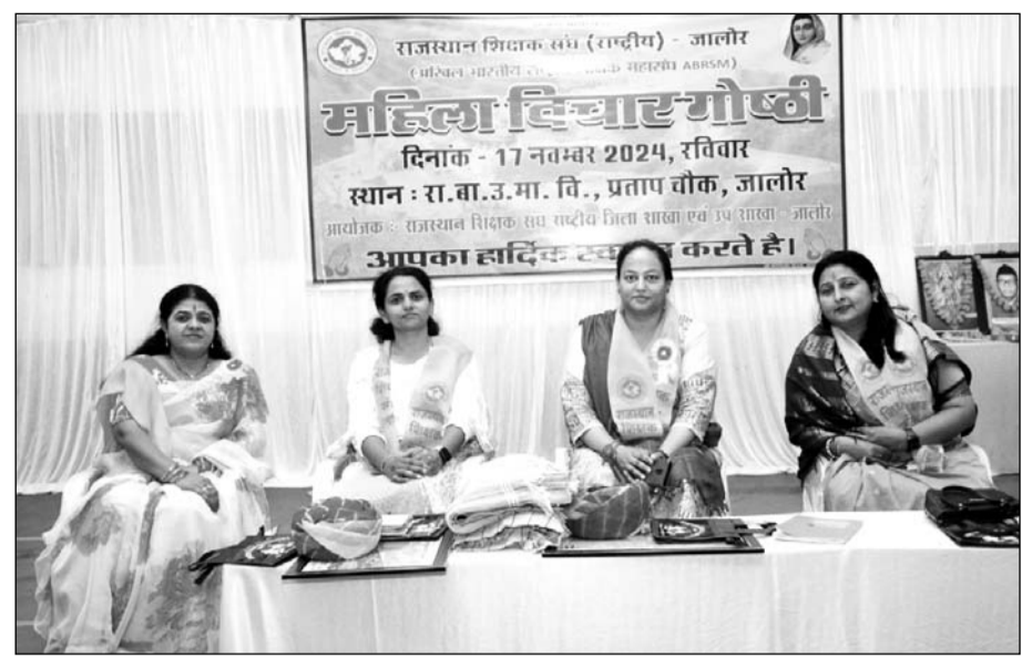
जालोर के राजकीय बालिका उच्च माध्यमिक विद्यालय प्रताप चौक में शिक्षक संघ राष्ट्रीय की महिला दिवस गोष्ठी हुई।