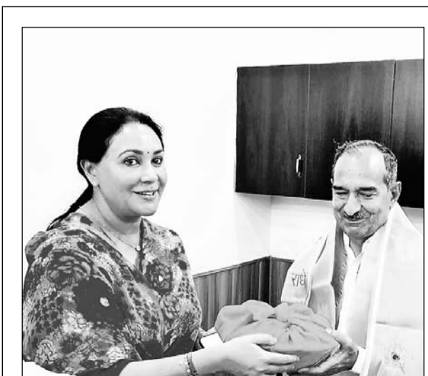
उपमुख्यमंत्री दिया कुमारी और प्रेमचंद बेरवा ने भाजपा के नवनियुक्त प्रदेश अध्यक्ष व राज्यसभा सांसद मदन राठौड़ से मुलाकात कर उनकी शुभकामनाएं दीं।

जयपुर। टीम 39 जहां चाह-वहां राह जन कल्याण ट्रस्ट एवं पानीपेच रोड व्यापार मंडल समिति ने रविवार को इंद्रा कॉलोनी पार्क, माधो कानन पार्क, अजमीड स्वर्णकार पार्क, डी-पार्क, डेजेंट कॉलोनी में वृक्षारोपण कार्यक्रम किया गया। टीम ने 251 पेड़-पौधे लगाए और उनकी सुरक्षा का संकल्प भी लिया।