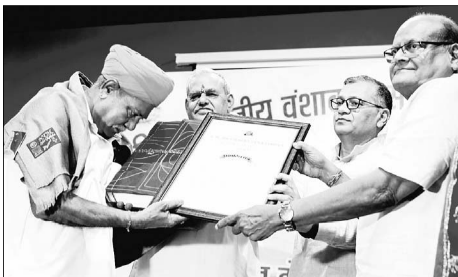
पाथेय कण के सभागार में आयोजित अखिल भारतीय वंशावली संरक्षण एवं संवर्द्धन संस्थान के स्थापना दिवस समारोह में वंशावली लेखकों को सम्मानित किया गया।