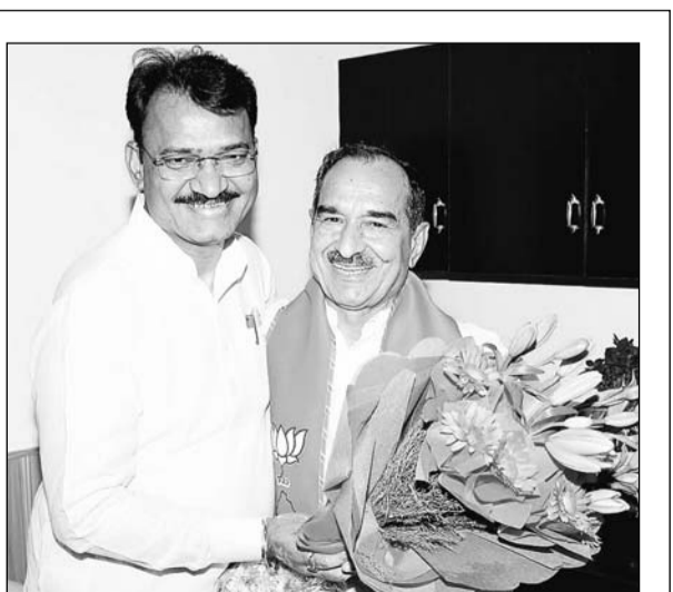
उपमुख्यमंत्री दिया कुमारी और प्रेमचंद बेरवा ने भाजपा के नवनियुक्त प्रदेश अध्यक्ष व राज्यसभा सांसद मदन राठौड़ से मुलाकात कर उनकी शुभकामनाएं दीं।