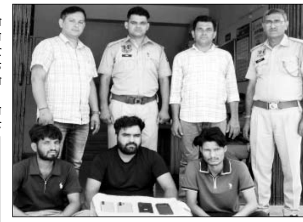
जामडोली थाना पुलिस ने फ्लिपकार्ट की डिलीवरी में महंगे सामान चुराने वाले बदमाशों को गिरफ्तार किया।

जयपुर। राजधानी में ऑनलाइन शॉपिंग कंपनियों और डिलीवरी नेटवर्क को निशाना बनाकर महंगे मोबाइल और इलेक्ट्रॉनिक सामान हड़पने वाले एक हाईटेक गिरोह का जामडोली थाना पुलिस ने पर्दाफाश किया है। पुलिस ने फ्लिपकार्ट से महंगे आईफोन, एंड्रॉयड फोन और आईपैड