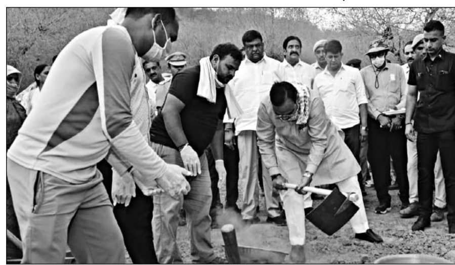
मुख्यमंत्री भजनलाल शर्मा ने शुक्रवार को नींदड वन क्षेत्र में बंदे गंगा जल संरक्षण-जन अभियान के तहत एनिकट पर श्रमदान किया।

जयपुर (कांस)। मुख्यमंत्री भजनलाल शर्मा ने शुक्रवार को नींदड वन क्षेत्र में नींदड-बैनाड बायोडाइवर्सिटी प्रोजेक्ट ईको ट्रेल का उद्घाटन किया। इस अवसर पर उन्होंने बंदे गंगा जल संरक्षण-जन अभियान के तहत एनिकट पर श्रमदान कर आमजन से जल संरचनाओं के संरक्षण एवं संवर्धन में सहभागिता निभाने का आह्वाण किया। मुख्यमंत्री ने कहा कि नींदड वन अत्यंत सुंदर और संभावनाओं से परिपूर्ण क्षेत्र है। राज्य सरकार इसे सघन पौधारोपण के माध्यम से विकसित करेगी, ताकि यहां प्रकृति पर्यटन को भी बढ़ावा मिल सके। उन्होंने कहा कि बंदे गंगा जल संरक्षण-जन अभियान के अंतर्गत