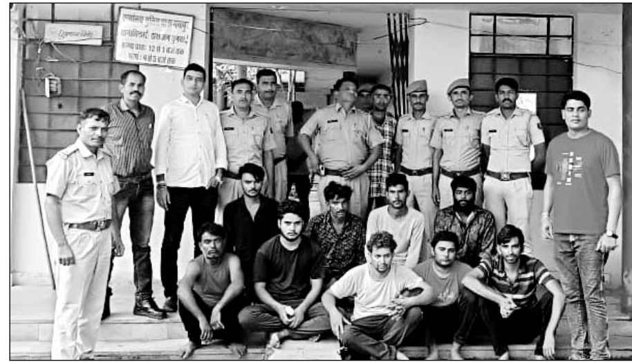
गंगापुर थाना पुलिस ने केबल चोरी गैंग का खुलासा कर नौ आरोपियों को गिरफ्तार किया।

धीलवाड़ा, (निर्स)। जिले की गंगापुर थाना पुलिस ने तांबे की केबल चोरी गैंग का खुलासा करते हुए अंतर्राज्यीय चोर गिरोह के नौ शांति आरोपियों को गिरफ्तार किया है।