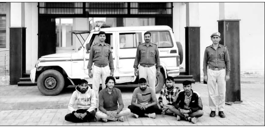
लक्की ड्रा के नाम पर ठगी करने के आरोपियों को पुलिस ने गिरफ्तार किया।