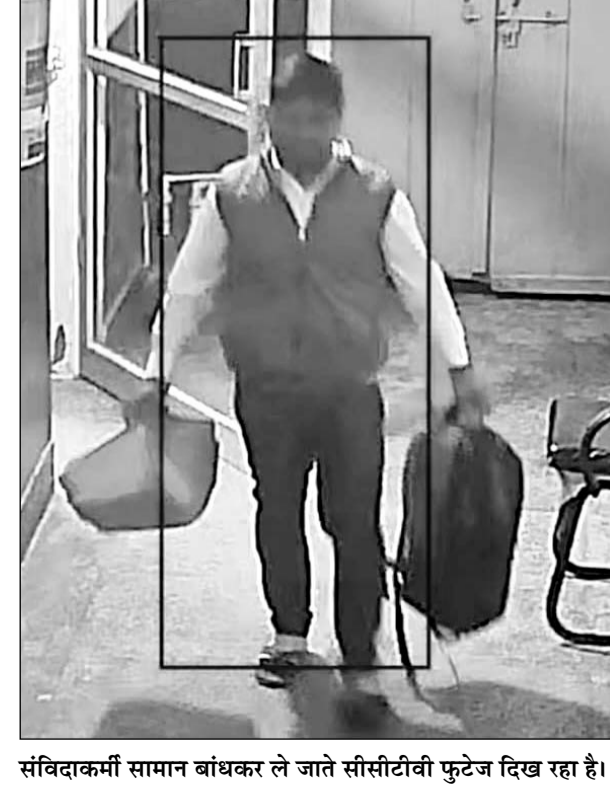
संविदाकर्मी सामान बांधकर ले जाते सीसीटीवी फुटेज दिख रहा है।

■ पूर्व विधायक व पूर्व ईओ के इशारे पर चोरी का आरोप