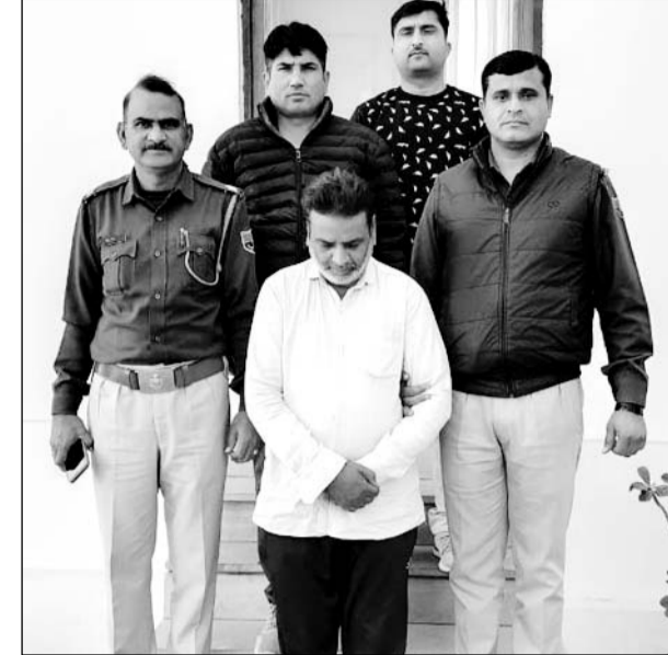
उदयपुर की सबीना थाना पुलिस ने नौकरी लगाने के नाम पर धोखाधड़ी करने वाले को गिरफ्तार किया।