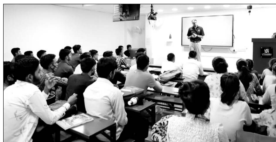
उत्कर्ष क्लासेस द्वारा बालोतरा में 10 वीं तथा 12 वीं बोर्ड उत्तीर्ण विद्यार्थियों के लिए व्यक्तिगत रूप से वन टू वन काउंसलिंग सेशन का आयोजन रखा गया।

जोधपुर, (कासं)। उत्कर्ष क्लासेस द्वारा बालोतरा के होटल मिलान में 10वीं तथा 12वीं बोर्ड उत्तीर्ण विद्यार्थियों के लिए शुकवार प्रातः 10 बजे से शाम 5 बजे तक व्यक्तिगत रूप से वन टू वन काउंसलिंग सेशन का आयोजन रखा गया। काउंसलिंग सेशन में उत्कर्ष, नीट-जेईई के एक्सपर्ट्स द्वारा विद्यार्थियों का व्यक्तिगत तौर पर मार्गदर्शन किया गया जिसमें विद्यार्थियों ने अपने भावी कैरियर हेतु मेडिकल या इंजीनियरिंग के विकल्पों में से सर्वोत्तम विकल्प का चयन व चयन में आने वाली सामान्य समस्याओं तथा उनसे जुड़ी अपनी जिज्ञासाओं का उचित समाधान प्राप्त किया।