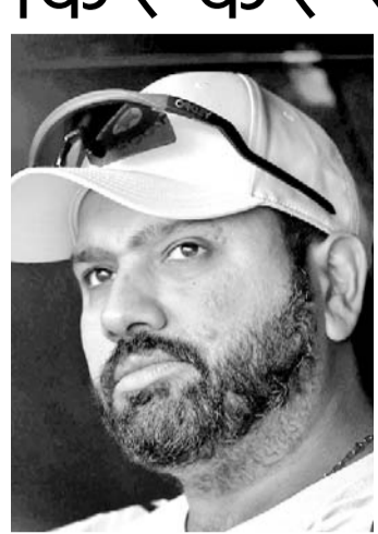
बीकेसी कॉम्प्लेक्स में दौड़ते रोहित शर्मा का वीडियो सोशल मीडिया पर काफी वायरल हो रहा है। भारत के पूर्व सलामी बल्लेबाज

मुंबई, 15 जनवरी। टीम इंडिया के कप्तान रोहित शर्मा पिछले कुछ समय से खराब फॉर्म से गुजर रहे हैं। उनके नेतृत्व में टीम का प्रदर्शन भी बेहद निराशाजनक रहा है। जून में टी20 वर्ल्ड कप जीतने के बाद भारतीय कप्तान की हर कोई तारीफ कर रहा था लेकिन कुछ ही महीने के अंदर चीजें पूरी तरह से बदल गईं। टी20 इंटरनेशनल से संन्यास ले चुके रोहित पर टेस्ट से भी रिटायरमेंट लेने का दबाव बनने लगा।