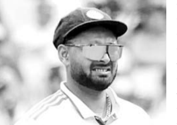
भारत के दोनों खिलाड़ियों को शेष सत्र के लिए दिल्ली के संभावित खिलाड़ियों की सूची में शामिल किया है। पंत ने अगले