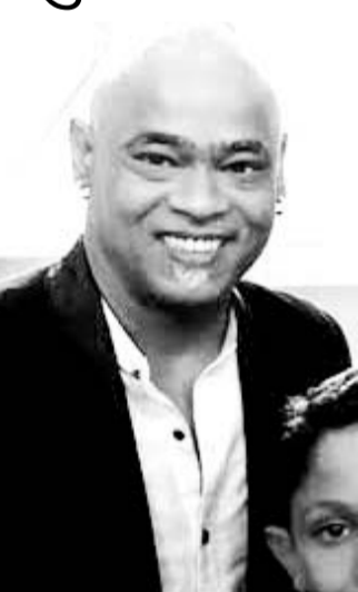
वीडियो में कांबली पहले पूर्व क्रिकेटर संजय मांजेकर से मिलते हैं फिर वह पूर्व बल्लेबाज वसीम जाफर से मुलाकात करते हैं। इसके बाद

मुंबई, 15 जनवरी। मुंबई के तमाम दिग्गज क्रिकेटरों हाल ही में मुंबई के वानखेडे स्टेडियम की 50वीं वर्षगांठ समारोह में पहुंचे थे, जिसे मुंबई क्रिकेट एसोसिएशन की ओर से आयोजित किया गया था। इस समारोह में टीम इंडिया के पूर्व बल्लेबाज विनोद कांबली भी पहुंचे थे। तमाम बीमारियों से जूझने वाले कांबली को हाल ही में हॉस्पिटल से डिस्चार्ज किया गया था।