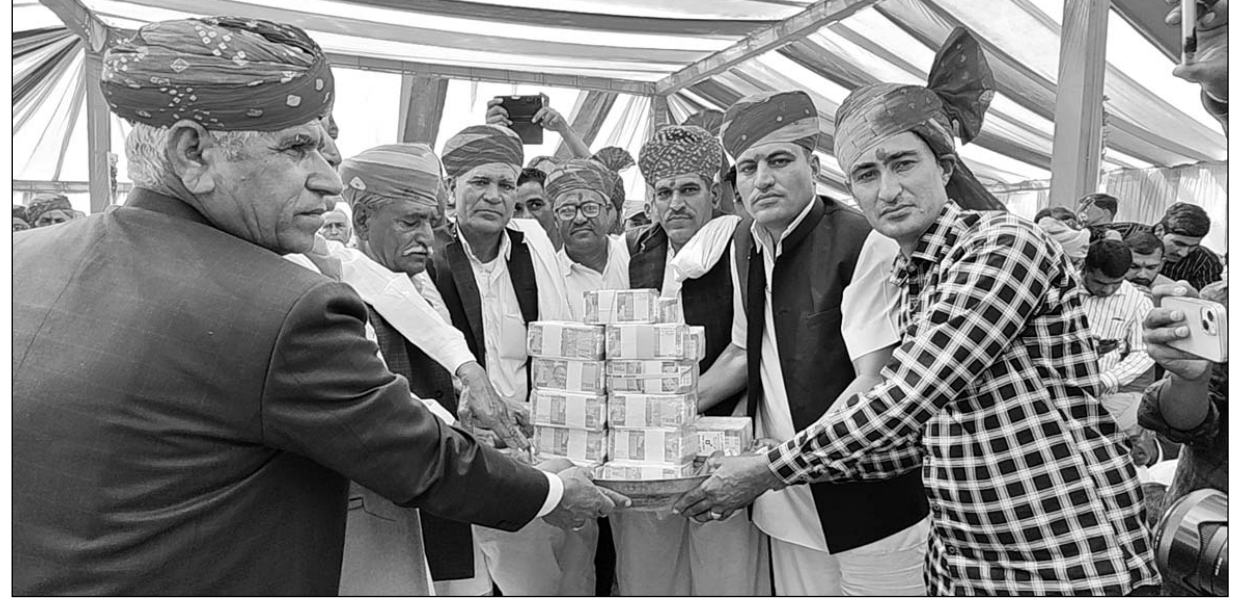
नागौर में सबसे बड़े मायरे की रस्म अदा करते परिवार के लोग।

गौरतलब है कि राजस्थान में एक भाई और बहन के अटूट प्रेम का रिश्ता है, जिसमें भाई बहन के मायरा भरकर उस फर्ज को निभाने का प्रयास करता है। 13 करोड़ 71 लाख का मायरा भरने के बाद पूरे राजस्थान में चर्चा है। मायरे में 1 करोड़ 31 लाख नगद,